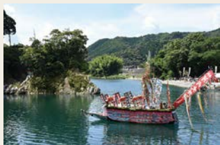
河内祭りの御舟行事 (串本町)