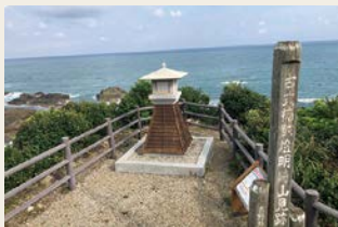
燈明崎 燈明台跡 (太地町)