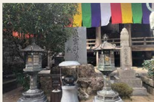
青岸渡寺の魚霊供養碑 (那智勝浦町)